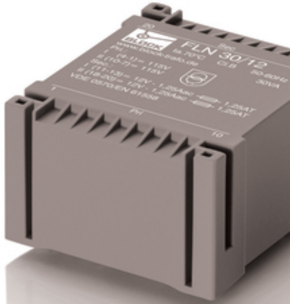
Photo de la ref. FLN 30/12