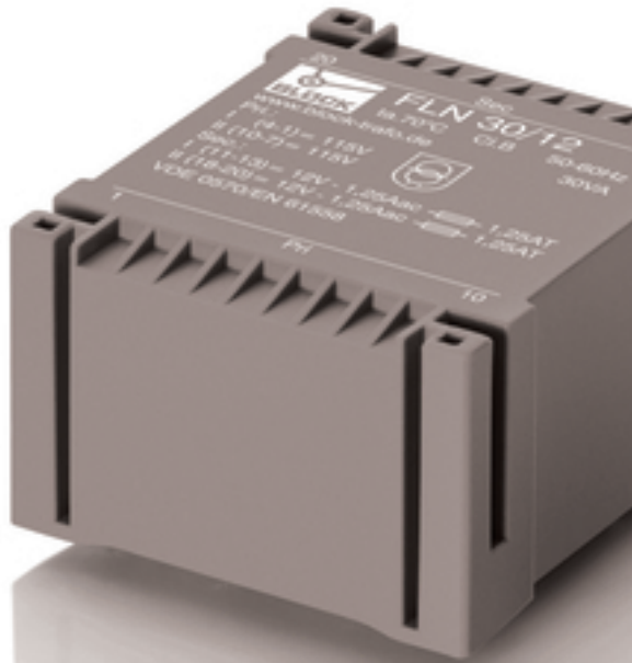
Photo de la ref. FLN 30/12