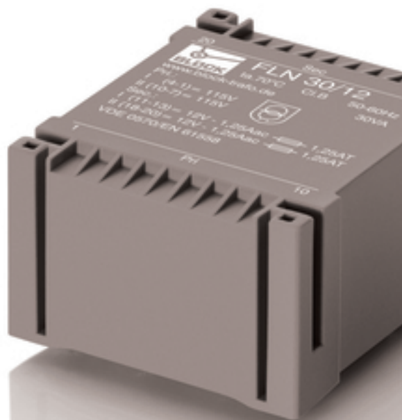
Photo de la ref. FLN 30/12