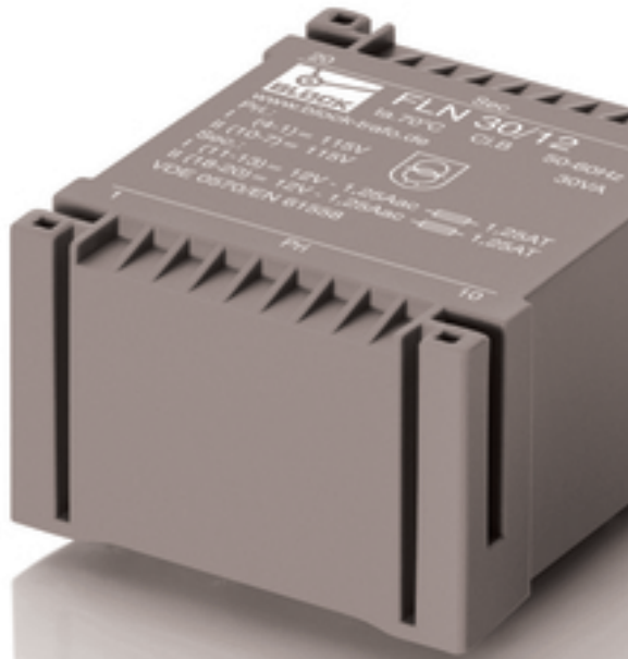
Abbildung zeigt FLN 30/12