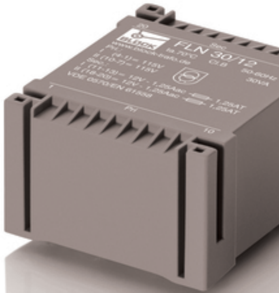
Photo de la ref. FLN 30/12