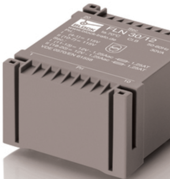
Photo de la ref. FLN 30/12