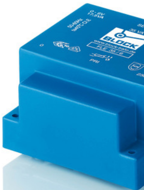
Photo de la ref. FLE 35/6