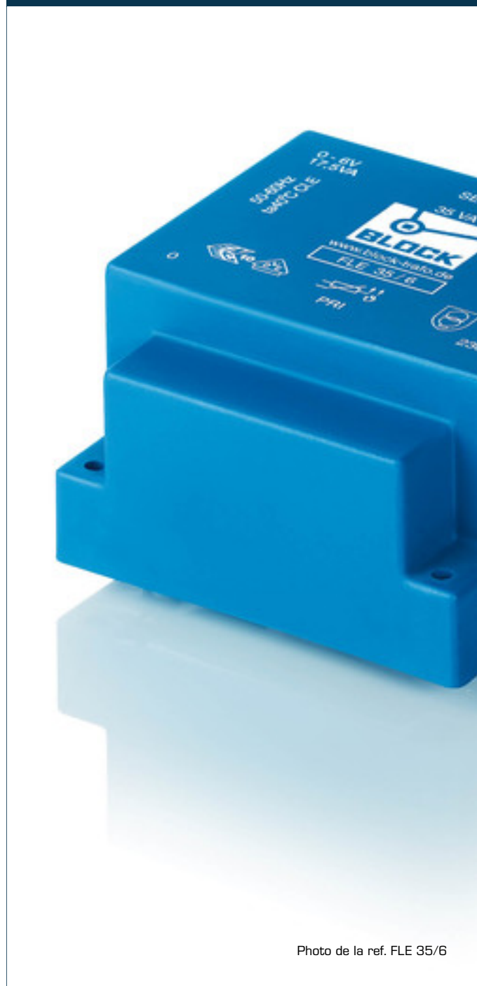
Photo de la ref. FLE 35/6