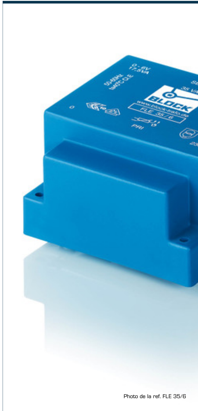
Photo de la ref. FLE 35/6