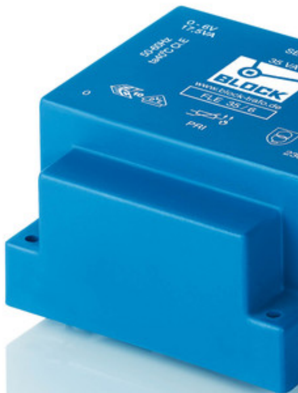
Photo de la ref. FLE 35/6