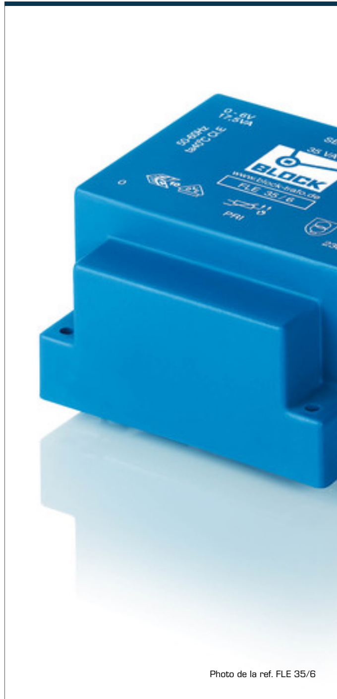
Photo de la ref. FLE 35/6