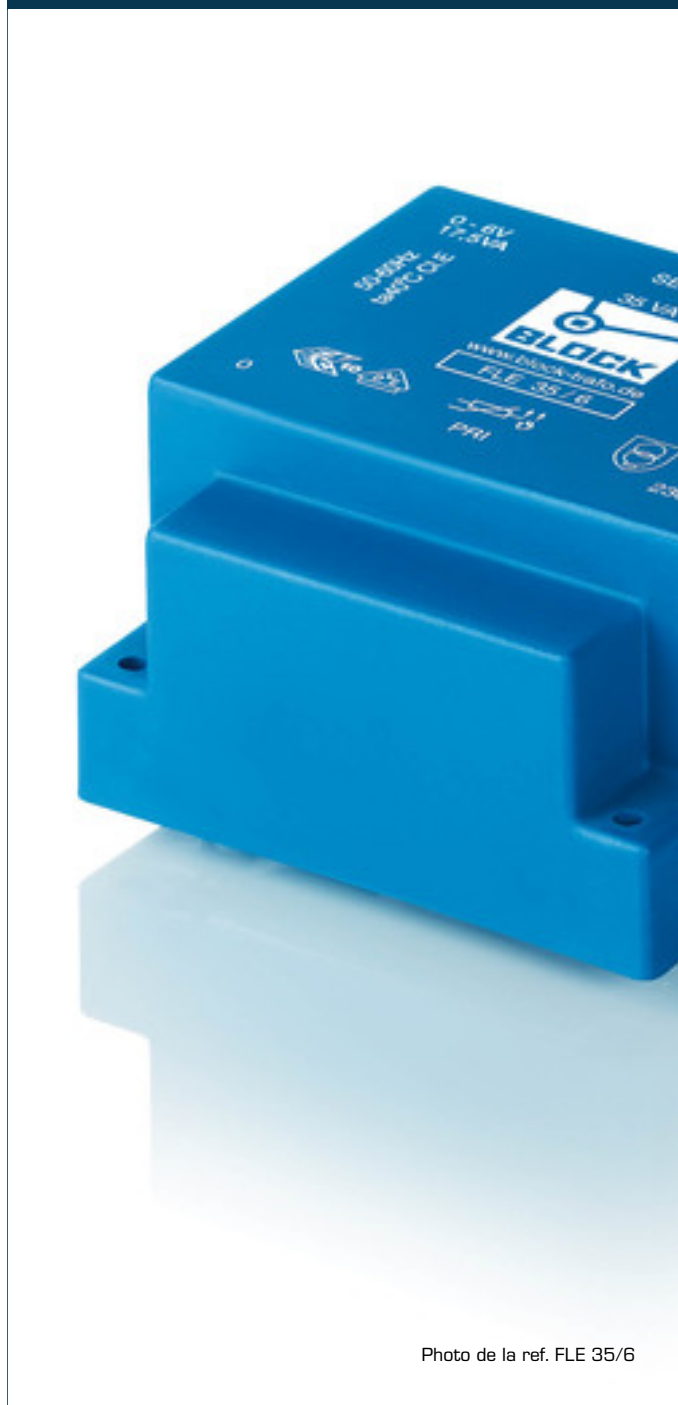
Photo de la ref. FLE 35/6