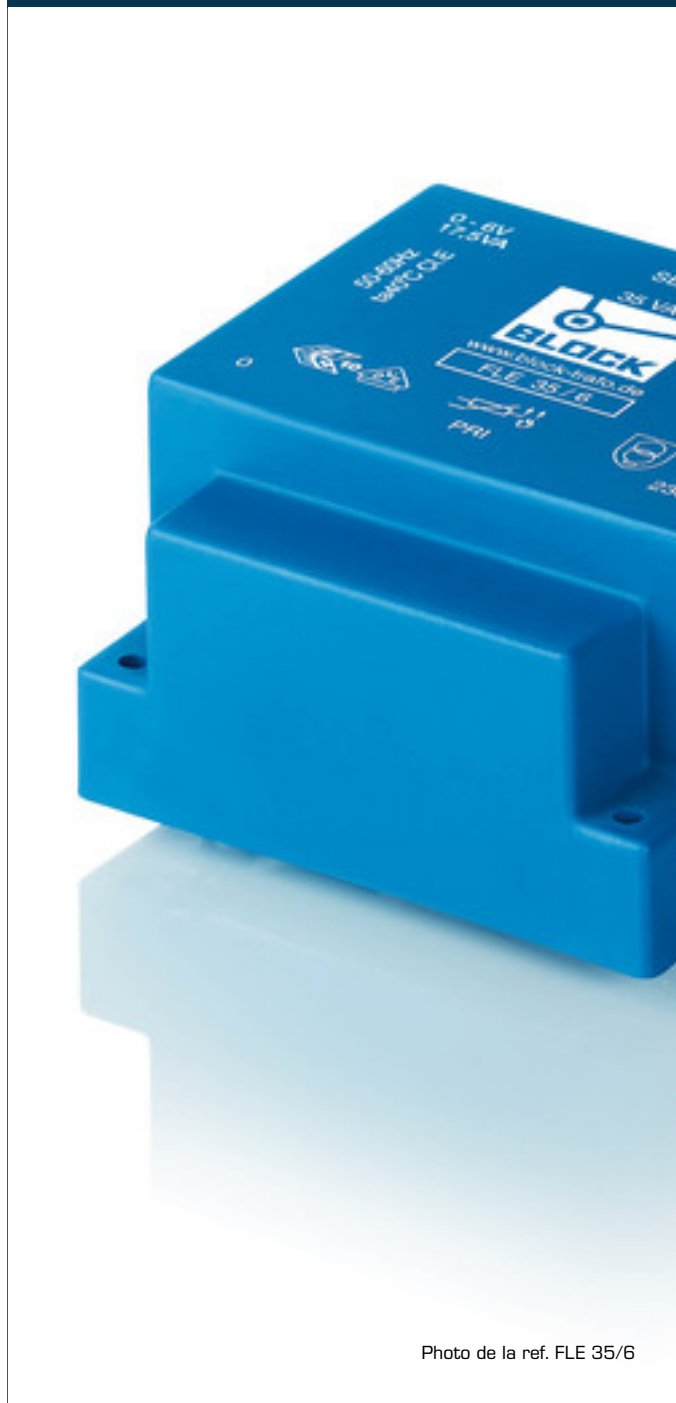
Photo de la ref. FLE 35/6