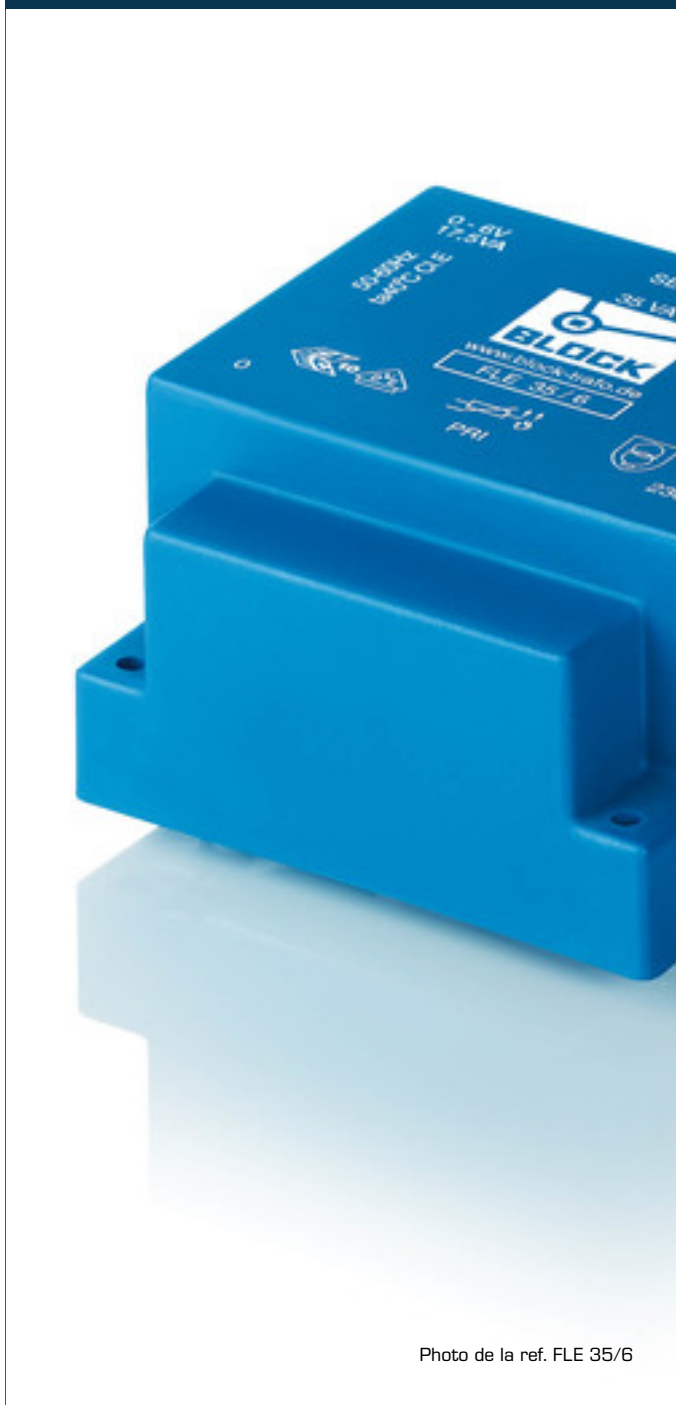
Photo de la ref. FLE 35/6