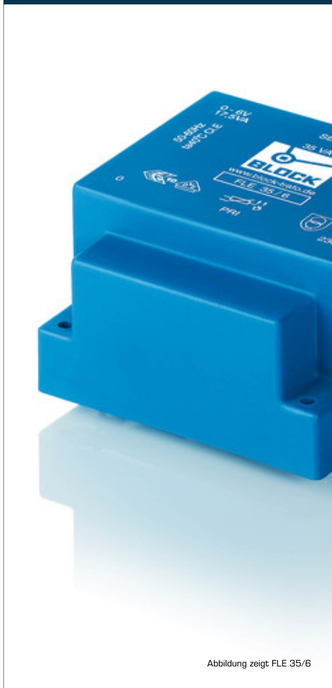
Abbildung zeigt FLE 35/6