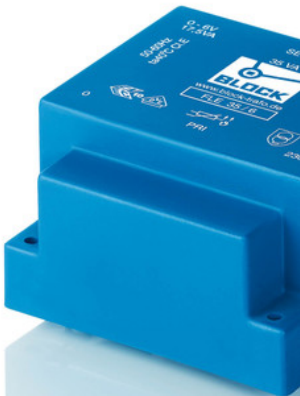
Photo de la ref. FLE 35/6