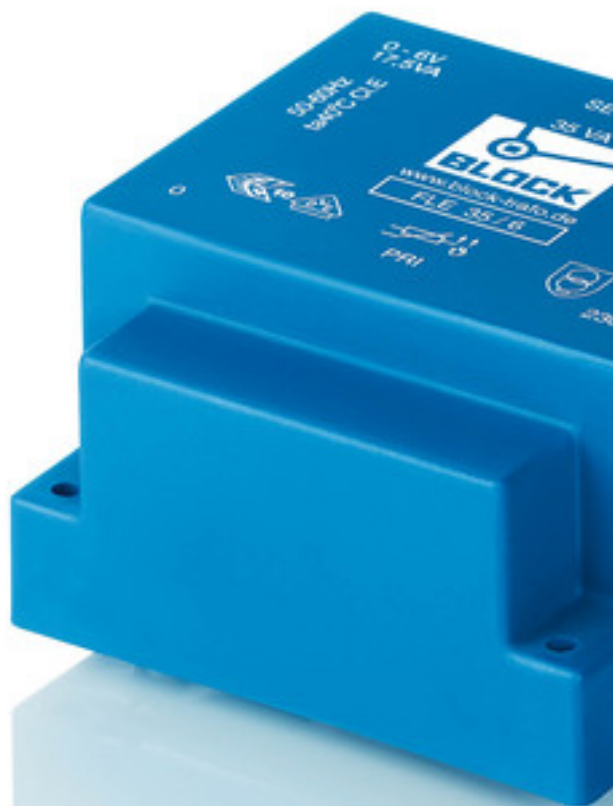
Photo de la ref. FLE 35/6