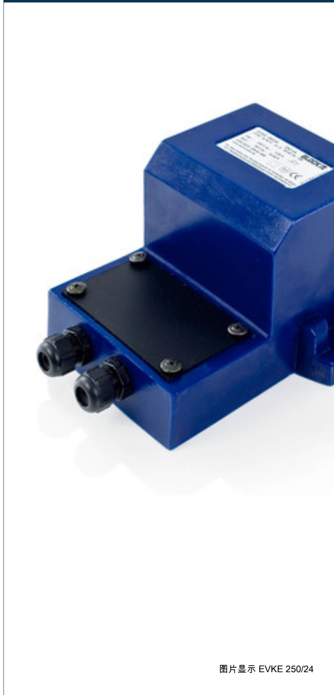
图片显示 EVKE 250/24