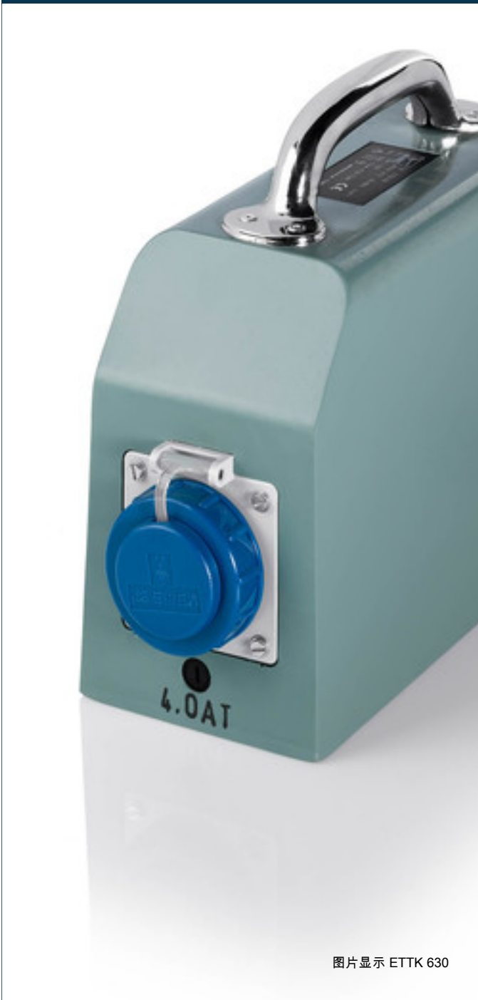
图片显示 ETTK 630