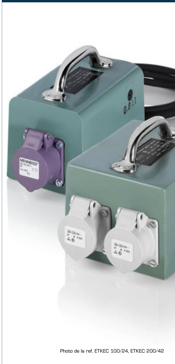
Photo de la ref. ETKEC 100/24, ETKEC 200/42