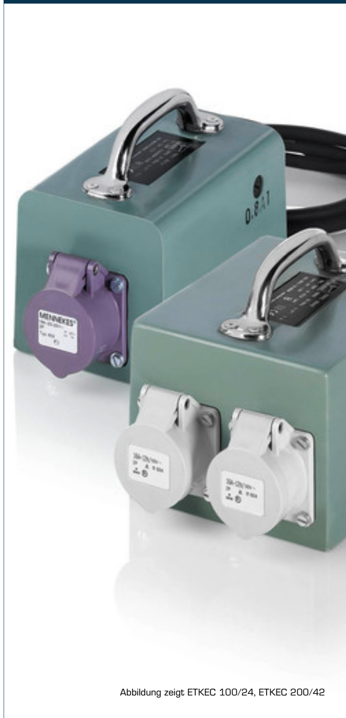
Abbildung zeigt ETKEC 100/24, ETKEC 200/42