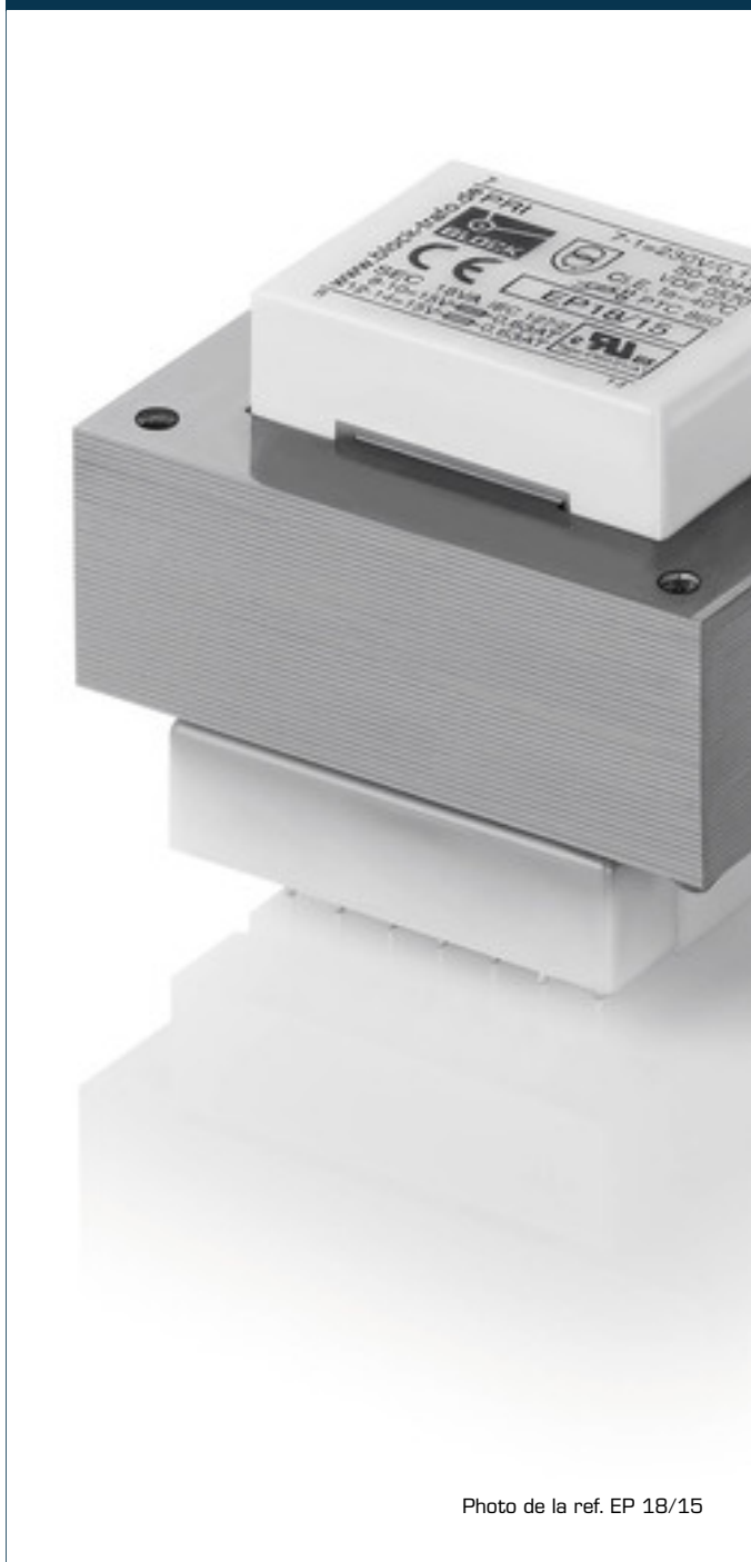
Photo de la ref. EP 18/15