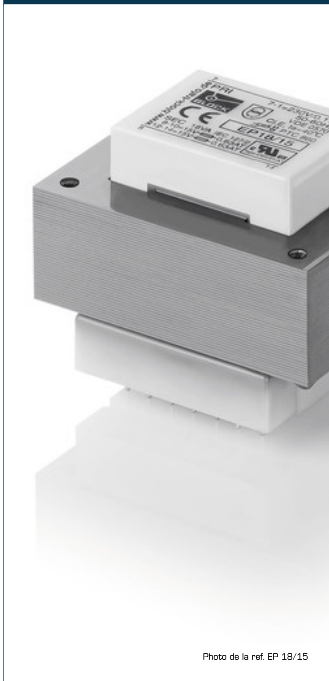
Photo de la ref. EP 18/15