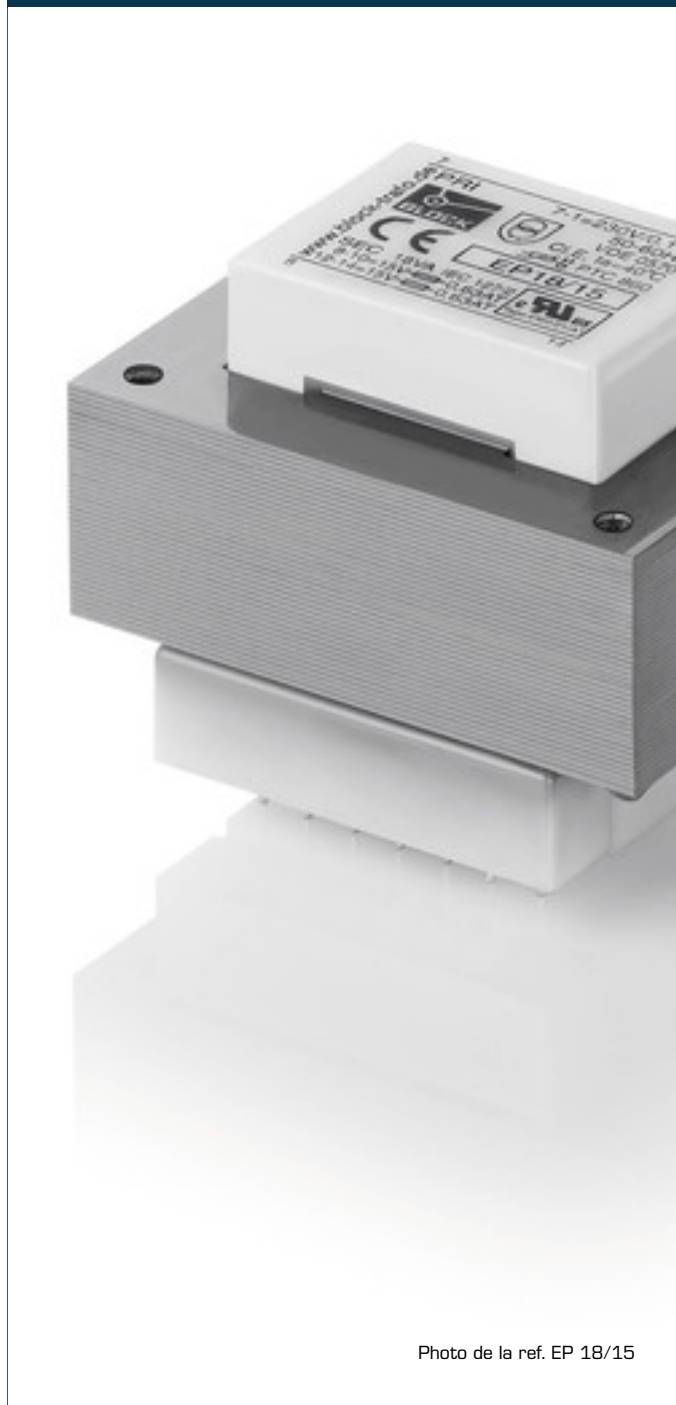
Photo de la ref. EP 18/15