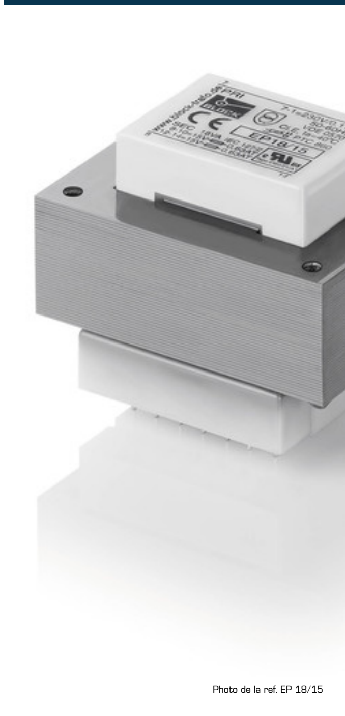
Photo de la ref. EP 18/15