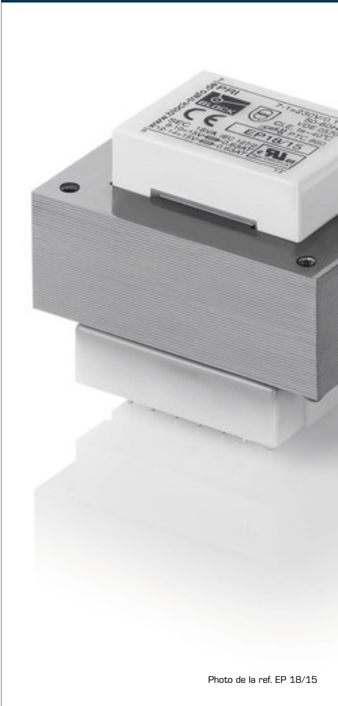
Photo de la ref. EP 18/15