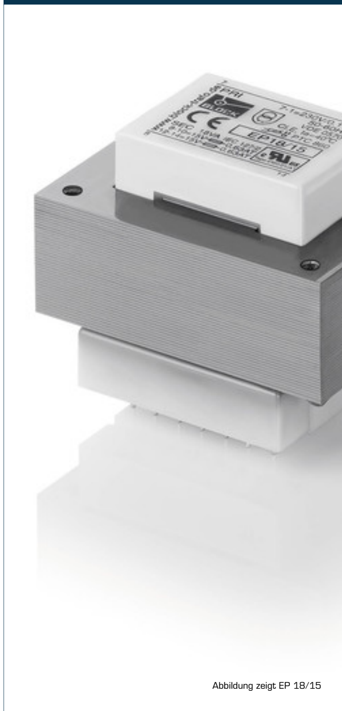
Abbildung zeigt EP 18/15