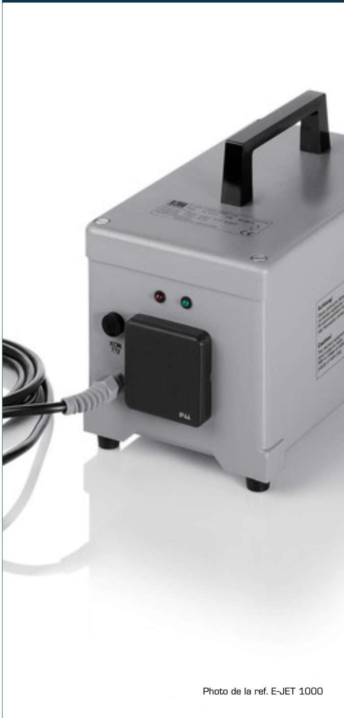
Photo de la ref. E-JET 1000