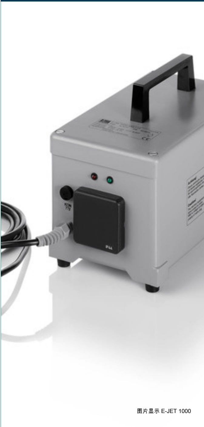
图片显示 E-JET 1000