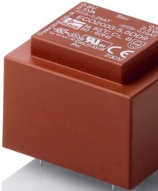
Photo de la ref. ECO2003-5,0-DD9