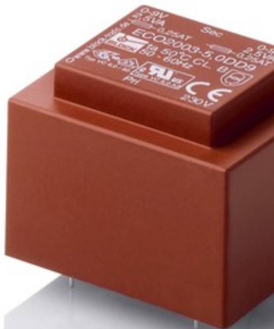
Photo de la ref. ECO2003-5,0-DD9