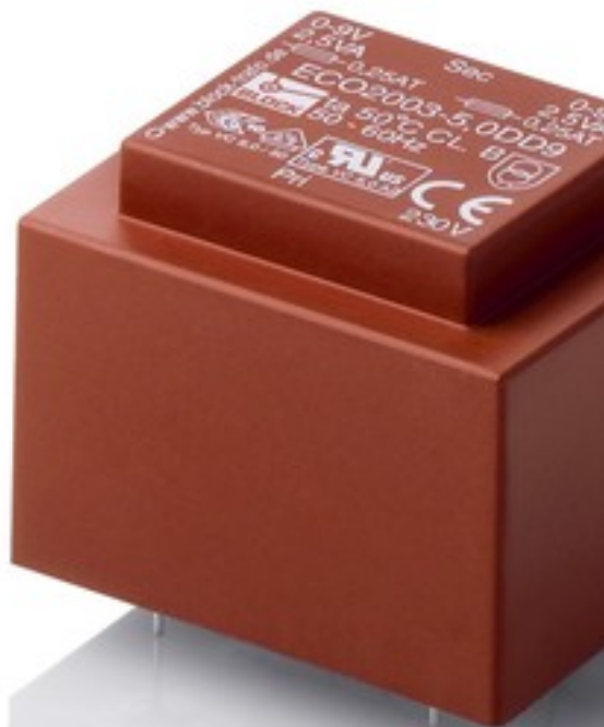
Photo de la ref. ECO2003-5,0-DD9