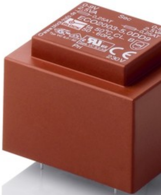
Abbildung zeigt ECO2003-5,0-DD9