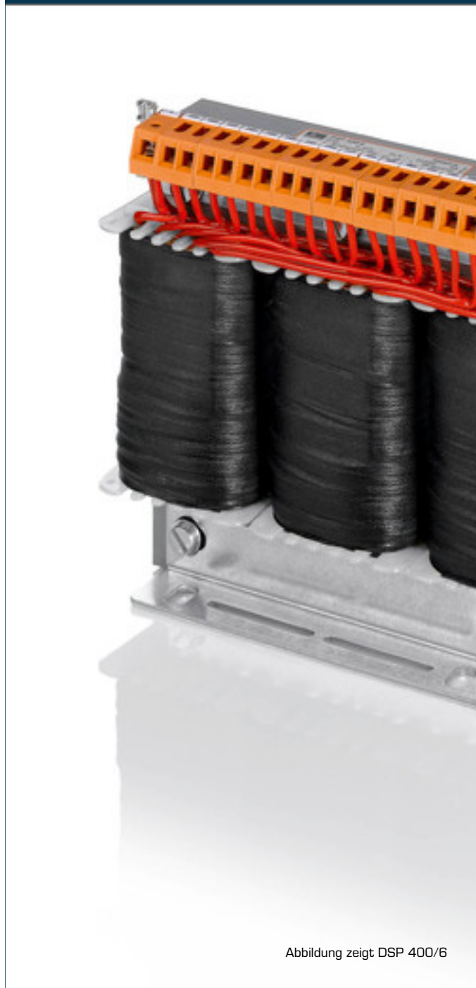
Abbildung zeigt DSP 400/6