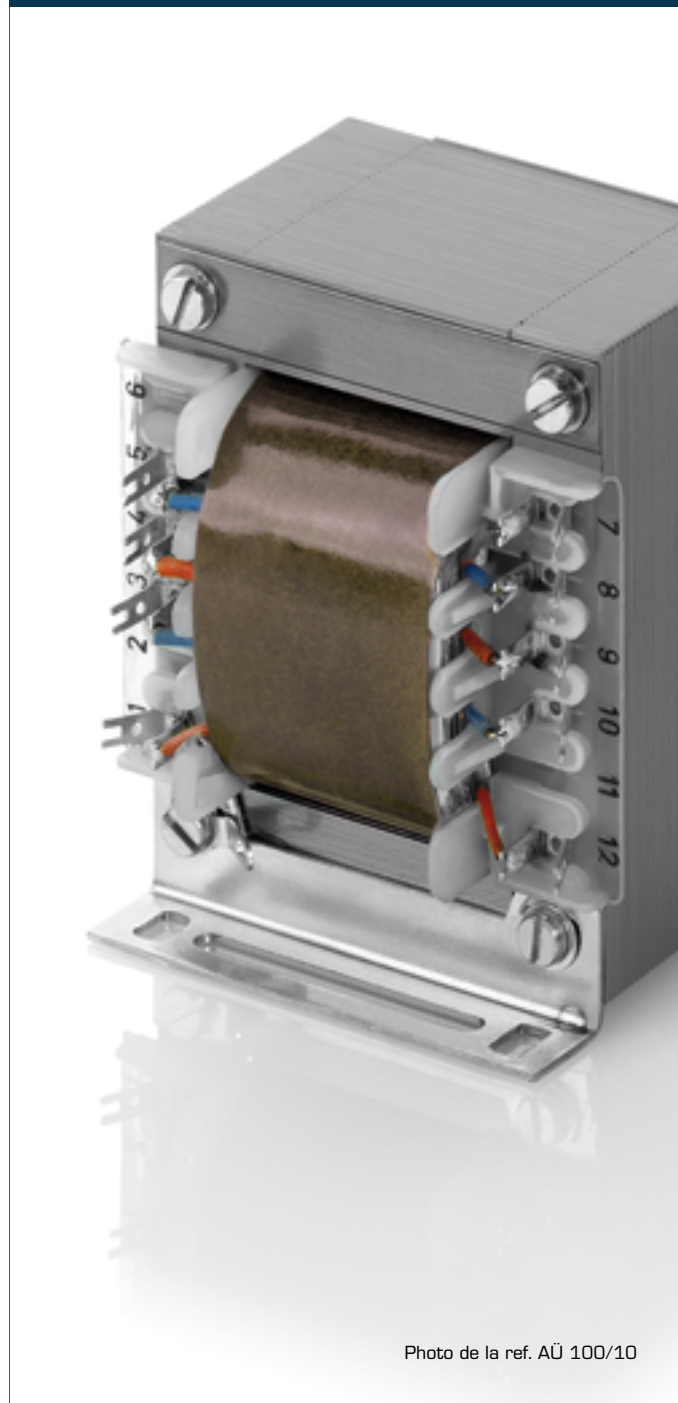
Photo de la ref. AÜ 100/10