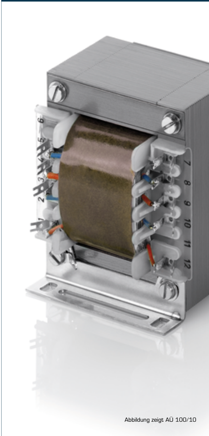
Abbildung zeigt AÜ 100/10